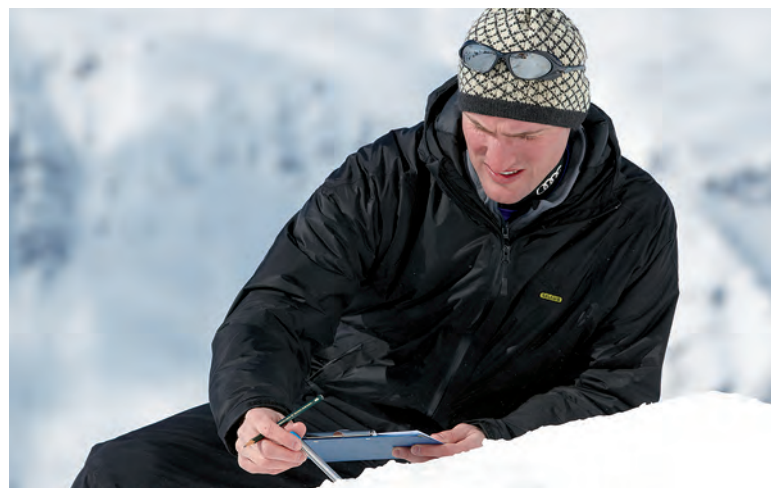
Der DSV skiTEST in Obergurgl ist keine Spaß-Veranstaltung: Ausfüllen der Testbogen, Einstellen der Bindungen und Kontrolle der Schneesverhältnisse stehen an der Tagesordnung.

des Profi-Test-Teams beim DSV skiTEST. Ist der ambitionierte Skifahrer, der gerne in kurzen Speed-Turns über die Pisten carvt, plötzlich zum Softie mutiert? Wohl kaum, vielmehr hat sich das, was sich hinter dem Namen Genusscarver verbirgt, in den vergangenen 2 bis 3 Jahren deutlich gewandelt.